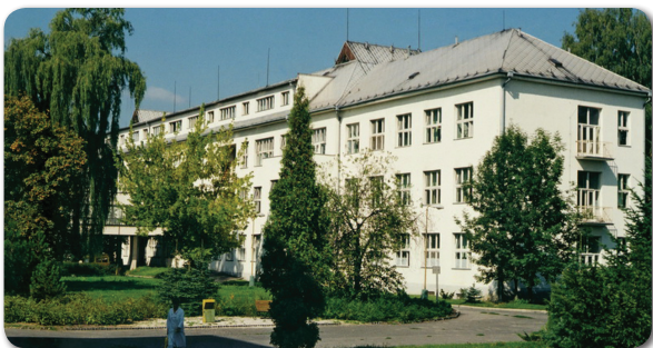
Chirurgický pavilón ( postavený 1933 / súčasne po generálnej rekonštrukcii )